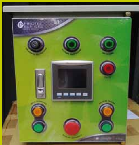
° Foto real Comprobador de Equipos de Seguridad de Nivel de Agua para Calderas

La “no inspección periódica” comprobable y medible de sus equipos de control de nivel de agua en sus calderas, genera pérdida en la reclamación por siniestros ante las compañías aseguradoras. Para ello la instalación del comprobador de equipos de seguridad de nivel de agua para calderas será, no solamente su equipo vigía de la vida de su personal y de sus bienes, sino además un aliado en la elaboración de informes y estadísticas de la rutina de inspección.